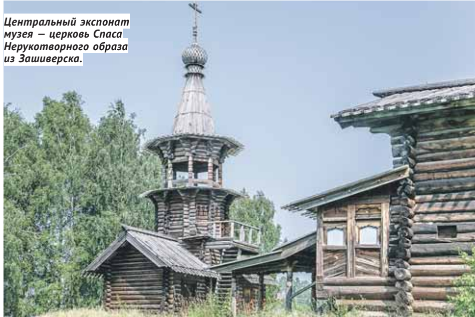
Центральный экспонат музея — церковь Спаса Нерукотворного образа из Зашиверска.

ческая зона с реконструкцией родового святилища манси, экспериментальный археологический полигон, где представлены действующие копии ловушек, которыми пользовались первобытные люди.