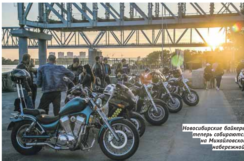
Новосибирские байкеры теперь собираются на Михайловской набережной.

Одним словом, давайте жить дружно и не мешать друг другу летом отдыхать. И не только летом.