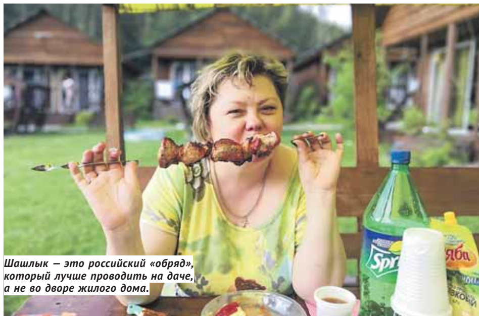
Шашлык — это российский «обряд», который лучше проводить на даче, а не во дворе жилого дома.

Летом «оттаивают» байкеры, дрифтеры и прочие ночные мото- и автолюбители, шумно гоняющие по городским магистралям, как по взлётной полосе. Одно время любители громких «покатушек» дислоцировались на пятаке у площади Ленина, но в 2013 году комиссия из сотрудников департамента транспорта мэрии и ГИБДД наконец-то услышала мольбы горожан, страдающих от вынужденной бессонницы, и поставила там знак, запрещающий останавливаться по ночам. А потом и вовсе запретила мотоциклистам ездить с 22 часов до 7 часов