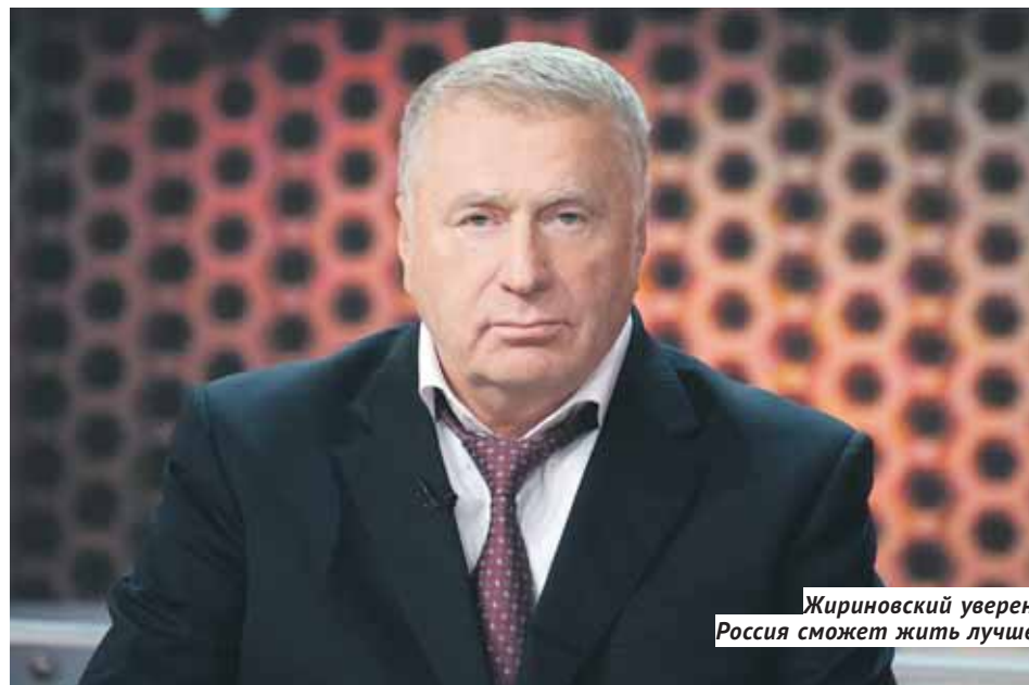
Жириновский уверен: Россия сможет жить лучше.

«Брежнев испугался использовать эту возможность, чтобы сделать СССР новым мировым гегемоном», — отмечает Владимир Жириновский.