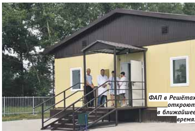
ФАП в Решётах откроют в ближайшее время.